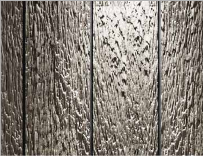
Borke - gleichmäßige, vertikale Fugen Borke - uniform vertical grooves