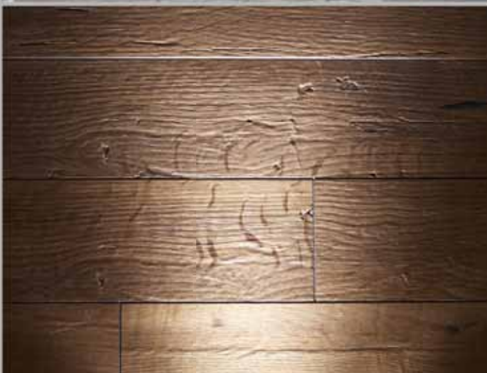
Old Nature - Fugen gleichmäßig versetzt Old Nature - grooves equally offset grid