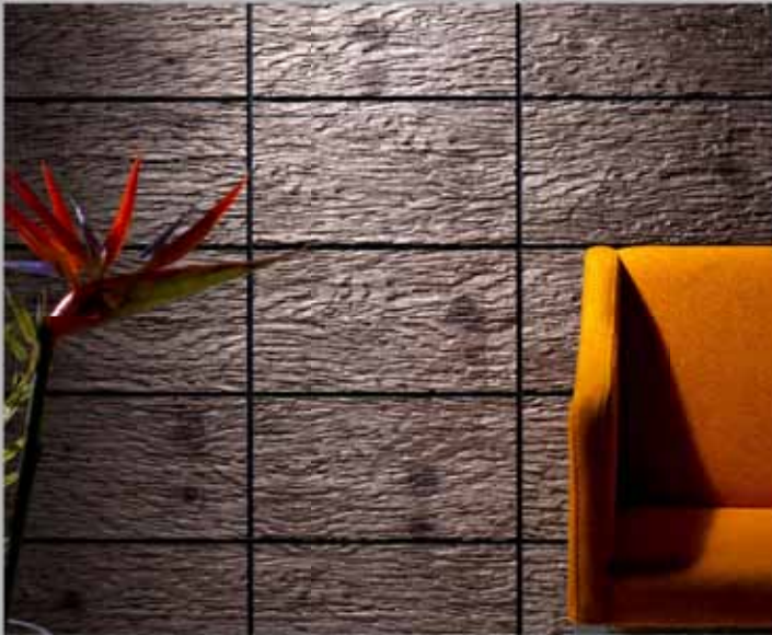
Borke - Fugen im Rechteckraster Borke - grooves in rectangular grid