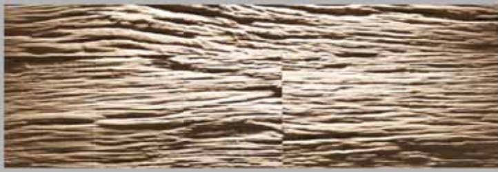
Authentische Strukturen. genuine structures.